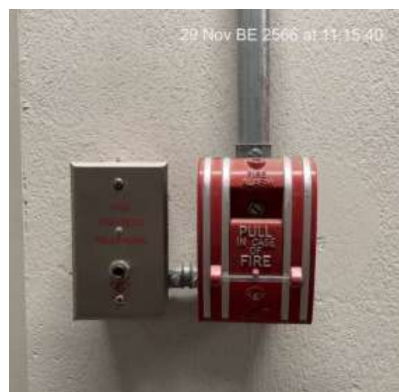
ภาพที่ 2.2-6 การบริหารจัดการด้านอัคคีภัย เหตุฉุกเฉิน และการสาธารณสุข