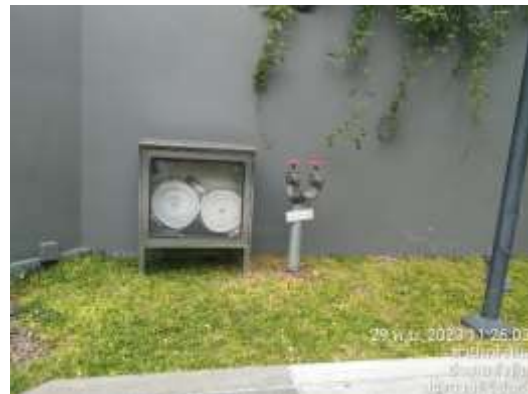
ภาพที่ 2.2-6 (ต่อ) การบริหารจัดการด้านอัคคีภัย เหตุฉุกเฉิน และการสาธารณสุข