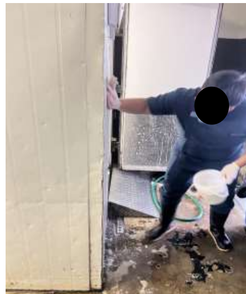
ภาพที่ 2.2-9 (ต่อ)การบริหารจัดการขยะมูลฝอย