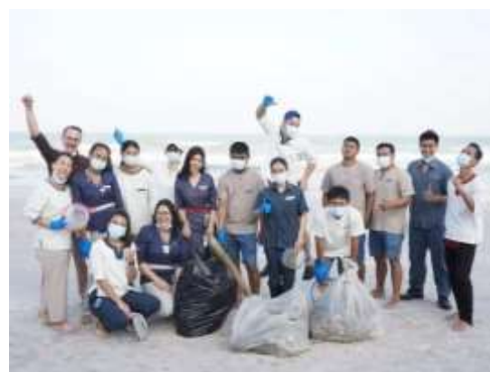
ภาพที่ 2.2-11 การบริหารจัดการด้านสังคม