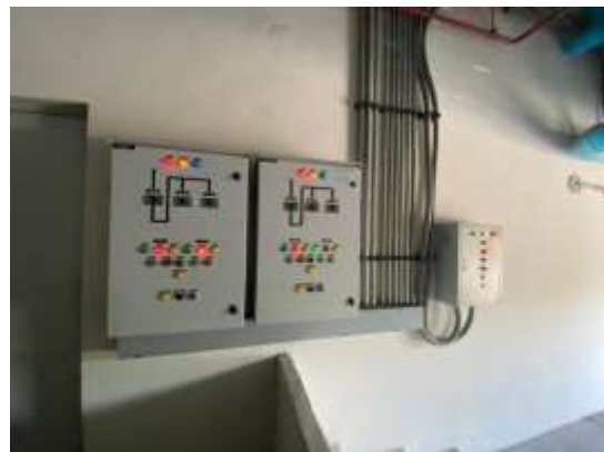
ภาพที่ 2.2-8 การบริหารจัดการระบบน้ำใช้