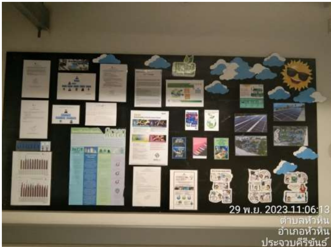
ภาพที่ 2.2-5 (ต่อ) การบริหารจัดการระบบไฟฟ้าและการอนุรักษ์พลังงาน