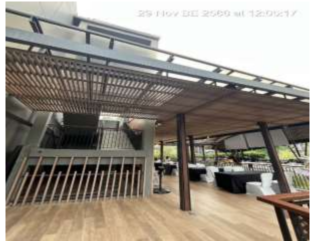
ภาพที่ 2.2-2 การบริหารจัดการด้านวิศวกรรมโครงสร้าง และสถาปัตยกรรม