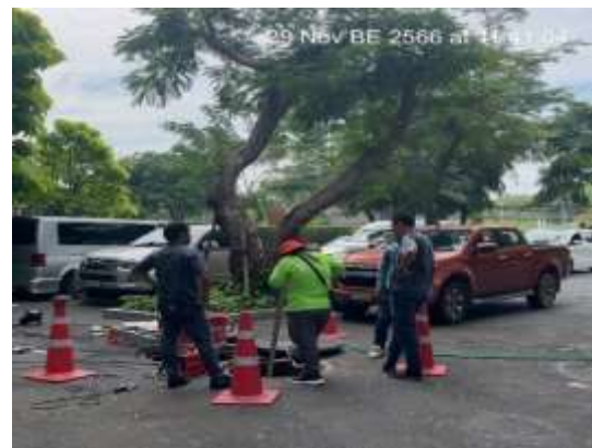
ภาพที่ 2.2-7 การบริหารจัดการระบบบำบัดน้ำเสีย