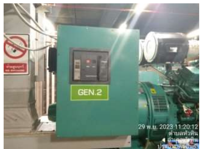
ภาพที่ 2.2-5 การบริหารจัดการระบบไฟฟ้าและการอนุรักษ์พลังงาน