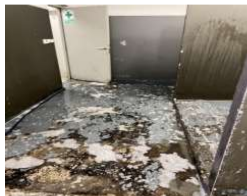
ภาพที่ 2.2-9 การบริหารจัดการขยะมูลฝอย