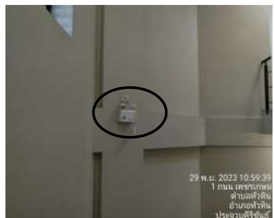
ภาพที่ 2.2-12 การบริหารจัดการด้านความปลอดภัย