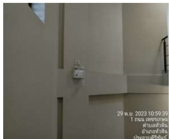
ภาพที่ 2.2-6 (ต่อ) การบริหารจัดการด้านอัคคีภัย เหตุฉุกเฉิน และการสาธารณสุข