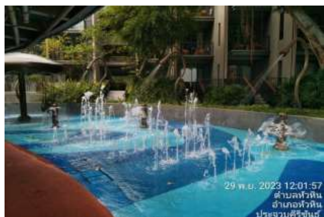
ภาพที่ 2.2-13 การบริหารจัดการสระว่ายน้ำ