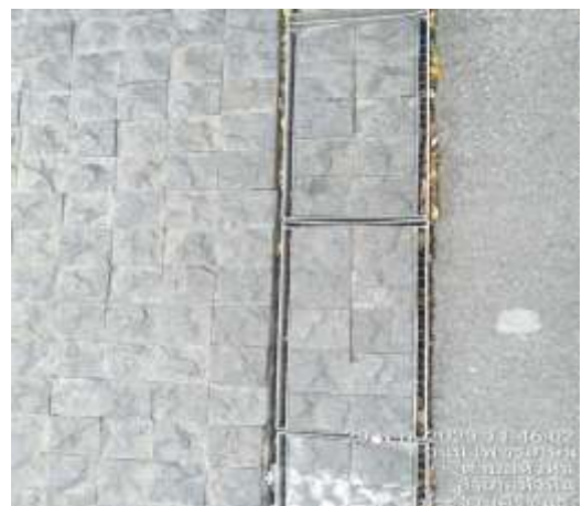
ภาพที่ 2.2-10 การบริหารจัดการระบบระบายน้ำ