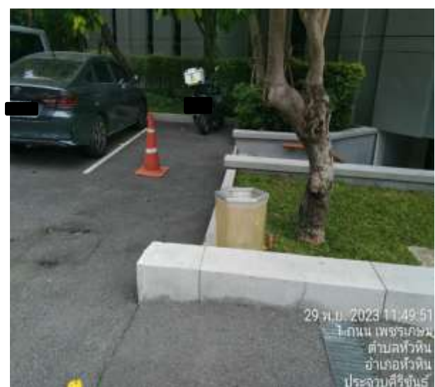
ภาพที่ 2.2-4 การบริหารจัดการระบบจราจร